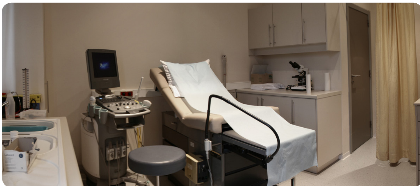
• Een consultkamer.

H et eerste bezoek aan de gynaecoloog begint met een gesprek waarin u uw klacht vertelt. Probeer de klacht zo goed mogelijk te verwoorden, liefst al voor uw eerste bezoek. Het is verstandig uw cyclus van de laatste maanden bij te houden en data op te schrijven. Eerst stelt de gynaecoloog u een paar vragen; hij/zij vraagt naar uw gezondheid, bijzonderheden in uw familie, eerdere bevallingen en/of zwangerschappen, of u medicijnen neemt, enzovoort. Eventueel volgen er vragen over seks. U hoeft zich echter niet te schamen, het hele gesprek is vertrouwelijk.